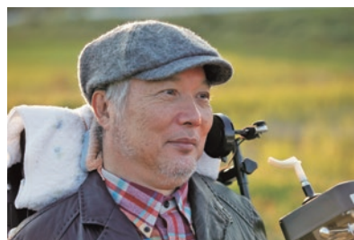
星野 富弘（ほしのとみひろ）

休止されていた「星野富弘花の詩画展」が、1994年の熊本県立美術館での開催を境に再開されます。それが契機となり、1年後に「星野富弘詩画がある芦北ふるさとギャラリー」が芦北町に開設。以後、交流が続くなかで富弘美術館（群馬県みどり市）の唯一の姉妹館として、2006年に「芦北町立星野富弘美術館」が誕生。当美術館は、星野富弘の詩画作品を常設展示しています。皆様には、星野の描く「いのちの尊さ・いのちの輝き」を感じていただければ幸いです。