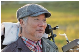
ほしの とみひろ 星野 富弘