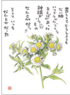
「なんとかなるさ」2014年